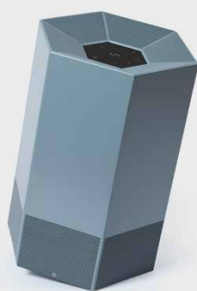
Bleu Saphir RÉF. 8 77 2127-BL