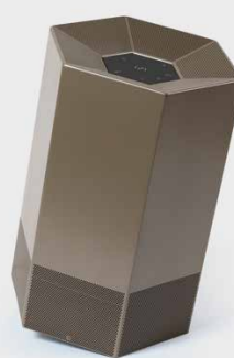
Bronze RÉF. 8 77 2127-BR