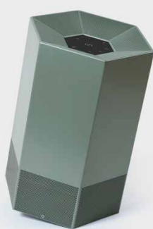
Vert Malachite RÉF. 8 77 2127-GR