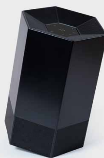
Noir mat RÉF. 8 77 2127-BK