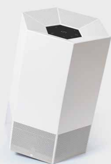
Blanc crème RÉF. 8 77 2127-WH